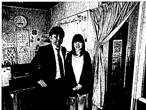
UNさん(札北⇒慶応大卒)