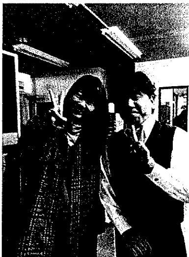
SAさん(登別明日⇒琉球大在学中)